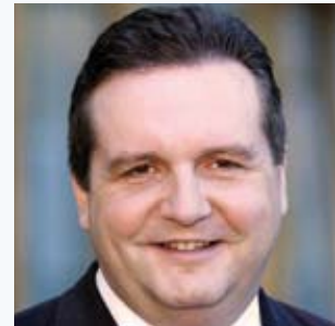
Stefan Mappus, Ministerpräsident von Baden-Württemberg

STEFAN MAPPUS: Dem drohenden Fachkräftemangel begegnen wir mit einem ganzen Bündel an Maßnahmen: Mit dem Ausbauprogramm „Hochschule 2012“, im Rahmen dessen bis 2012 insgesamt 20.000 zusätzliche Studienanfängerplätze, d. h. Studienplätze für rund 80.000 Studierende, geschaffen werden, setzt das Land verstärkt auf die Förderung arbeitsmarktrelevanter Studienangebote. Vor allem an der Dualen Hochschule Baden-Württemberg und den Hochschulen für angewandte Wissenschaften werden neue innovative Studiengänge etabliert, ich nenne nur den Arztassistenten oder die Studiengänge mit engem Bezug zur Elektromobilität. Vier von zehn Studienanfängerplätzen werden im Bereich der MINT-Fächer und weitere vier im Bereich der Wirtschafts-, Rechts- und Sozialwissenschaften geschaffen. Mit den zusätzlichen Studienanfängerplätzen sind unsere Hochschulen nicht nur besonders gut für die Herausforderungen des Abiturjahrgangs 2012 gewappnet, vielmehr leisten wir damit einen unmittelbaren Beitrag, die junge Generation bestmöglich auszubilden und damit dem Fachkräftemangel vorzubeugen. Und