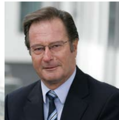
Bildungsbotschafter der didacta: Samy Deluxe und Dr. Klaus Kinkel